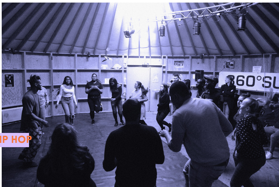
ATELIER SALSA HIP HOP