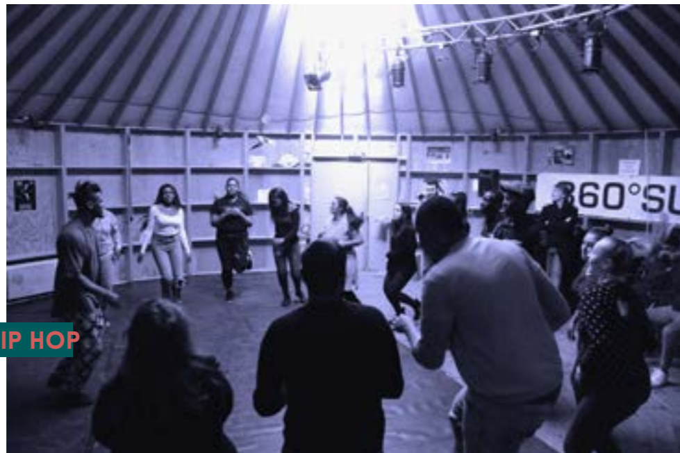
ATELIER SALSA HIP HOP